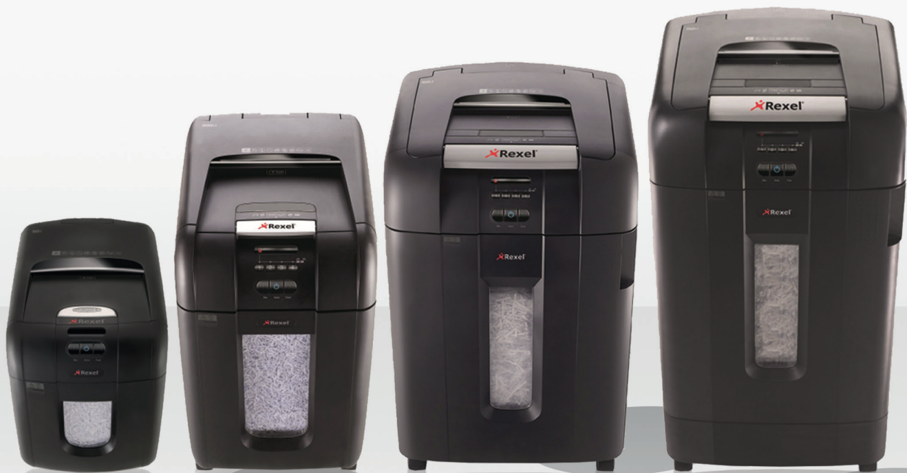
Auto+ 100M Für den persönlichen Gebrauch (1 bis 2 Benutzer)

Dann sollten Sie einen vollautomatischen Aktenvernichter mit Mikropartikelschnitt verwenden!